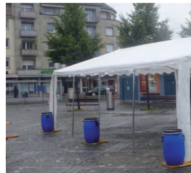
Impressionen vom 1. Lindenplatzhock